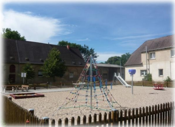
Spielplatz im Ort